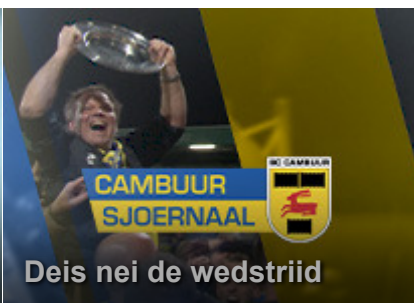
Deis nei de wedstriid