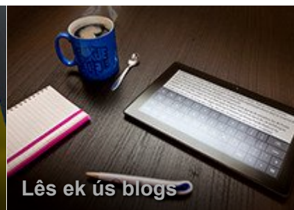
Lês ek ús blogs