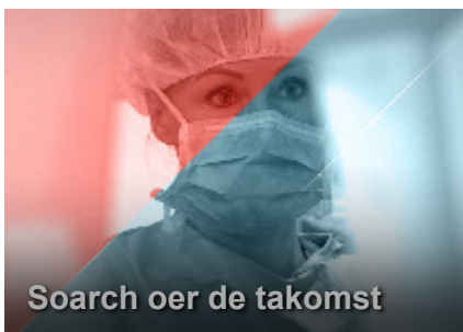
Soarch oer de takomst